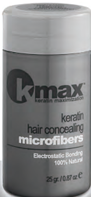
K-Max Keratin 27,50 gr.