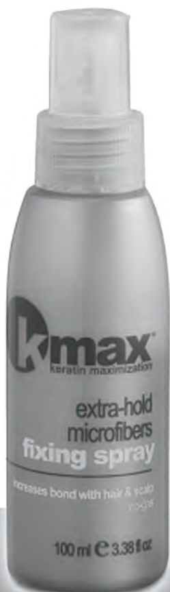
Spray Fijación K-Max