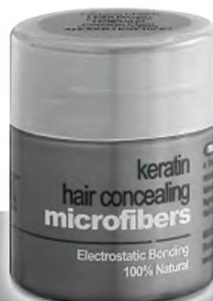
K-Max Keratin 12,50gr.